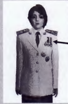
เครื่องแบบครึ่งยศ

เหรียญราชอิสริยาภรณ์ เช่น เหรียญจักรพรรดิมาลา เหรียญที่พระราชทานเป็นที่ระลึก ในโอกาสต่าง ๆ ให้ประดับโดยใช้แพรแถบ แบบบุรุษ