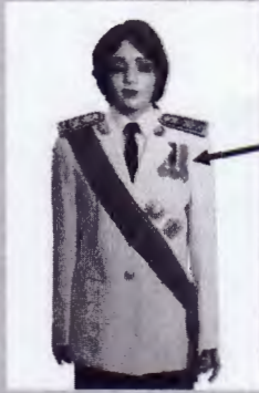
เครื่องแบบเต็มยศ