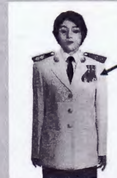
เครื่องแบบเต็มยศและครึ่งยศ

ห้อยกับแพรแถบแบบบุรุษ ประดับที่อกเสื้อเบื้องซ้าย ร่วมกับเหรียญราชอิสริยาภรณ์ และเหรียญที่พระราชทาน เป็นที่ระลึกในโอกาสต่าง ๆ