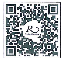
QR CODE สำหรับจองห้องพัก มหาวิทยาลัยศิลปากร