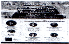
TSRI Talk (PL)-01.jpg 4 MB