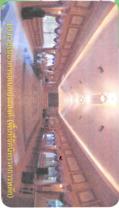
10. ภายในห้องอาหารอนุสาวรีย์เมืองโบราณ (พื้นที่จัดนิทรรศการหลัก)