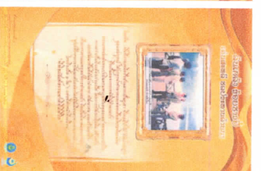
0.80 x 12.0 ม.