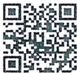
เอกสารประกอบข้อ ๑.