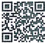
เอกสารประกอบข้อ ๓.