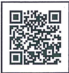
แบบฟอร์ม O3

เรียน ผอ.ส่วน ผอช.ภาค ทน.๑-๙ บอ. และหัวหน้าฝ่ายในส่วนบริหารทั่วไป