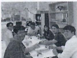
ส่วนแผนงาน จัดกิจกรรมโครงการพี่สอนน้องในหัวข้อการจัดทำประมาณ