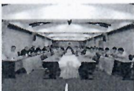
สขบ.3 และ สขบ.4 ร่วมประชุมหารือการป้องกันและแก้ปัญหาภัยแล้งประจำปี พ.ศ. 2567