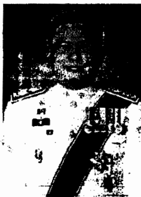
๓. นายมณฑิเยร เจริญผล รองผู้ว่าการตรวจเงินแผ่นดิน