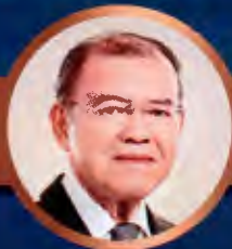
Dr. Supachai Panitchpakdi

Former Secretary-General of UNCTAD and Former Director-General of the World Trade Organization (WTO)