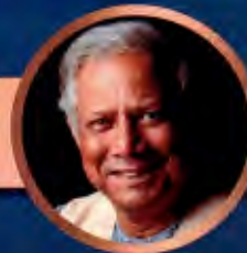
Prof. Muhammad Yunus