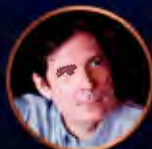
Mr. Christopher G. Moore Best International Crime Fiction Award Winning Writer