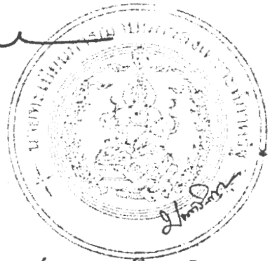
(นางสาวเบตรีสสา ไรจน์วดีศิริ) นักพัฒนาสังคมชำนาญการพิเศษ