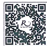
QR CODE สำหรับจองห้องพัก โรงแรมรอยัลริเวอร์

การสำรองห้องพัก ท่านสามารถจองห้องพักกับทางโรงแรมโดยสแกน QR-Code สำหรับจองห้องพัก หากท่านจองห้องพักภายหลังห้องพักอาจเต็มได้ และอาจจะไม่ได้ห้องพักราคาพิเศษซึ่งเป็นอัตราค่าที่พัก โรงแรมรอยัลริเวอร์ ๒๑๙ ซอยจรัญสนิทวงศ์ ๖๖/๑ แขวงบางพลัด เขตบางพลัด กรุงเทพฯ ๑๐๗๐๐ โทรศัพท์: ๐๒-๔๒๒-๙๒๒๒ โทรสาร : ๐๒-๔๓๓-๕๘๘๐ E-mail : rsvn@royalriverhotel.com