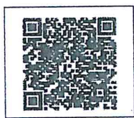
สิ่งที่ส่งมาด้วย ๒