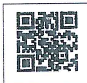
สิ่งที่ส่งมาด้วย ๔