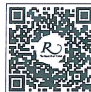
QR CODE สำหรับจองที่พัก มหาวิทยาลัยศิลปากร

การสำรองห้องพัก ท่านสามารถจองห้องพักกับทางโรงแรมโดยสแกน QR-Code สำหรับจองห้องพัก หากท่านจองห้องพักภายหลังห้องพักอาจเต็มได้ และอาจจะไม่ได้ห้องพักราคาพิเศษซึ่งเป็นอัตราค่าที่พัก โรงแรมรอยัลริเวอร์ ๒๑๙ ซอยเจริญสนิทวงศ์ ๖๖/๑ แขวงบางพลัด เขตบางพลัด กรุงเทพฯ ๑๐๗๐๐ โทรศัพท์: ๐๒-๔๒๒-๙๒๒๒ โทรสาร : ๐๒-๔๓๓-๕๘๘๐ E-mail : rsvn@royalriverhotel.com