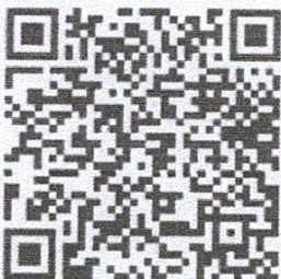
QR Code ลงทะเบียน ตามข้อ ๑