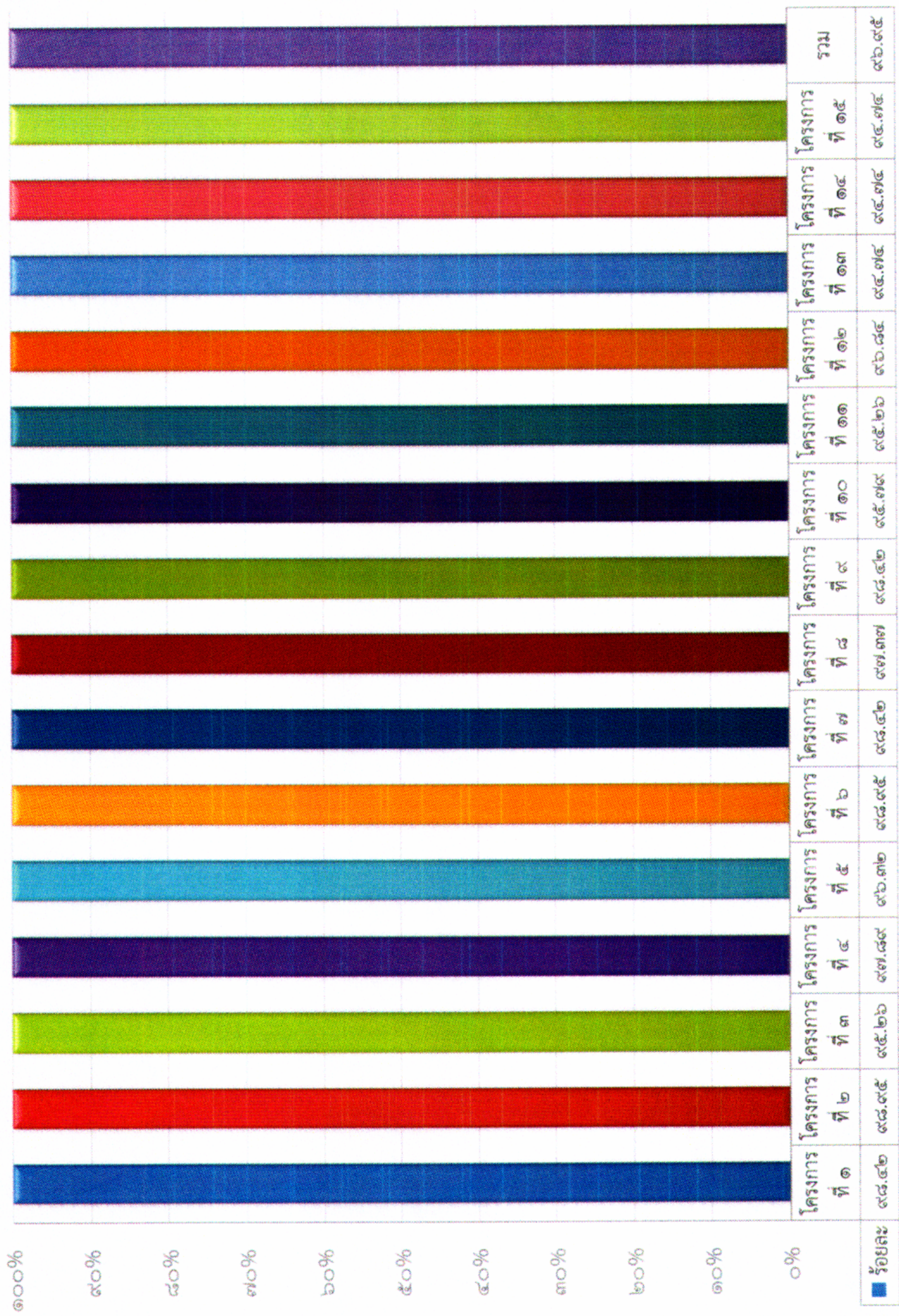
ร้อยละความสำเร็จของการดำเนินการตามแผนฯ (จำแนกรายโครงการ)