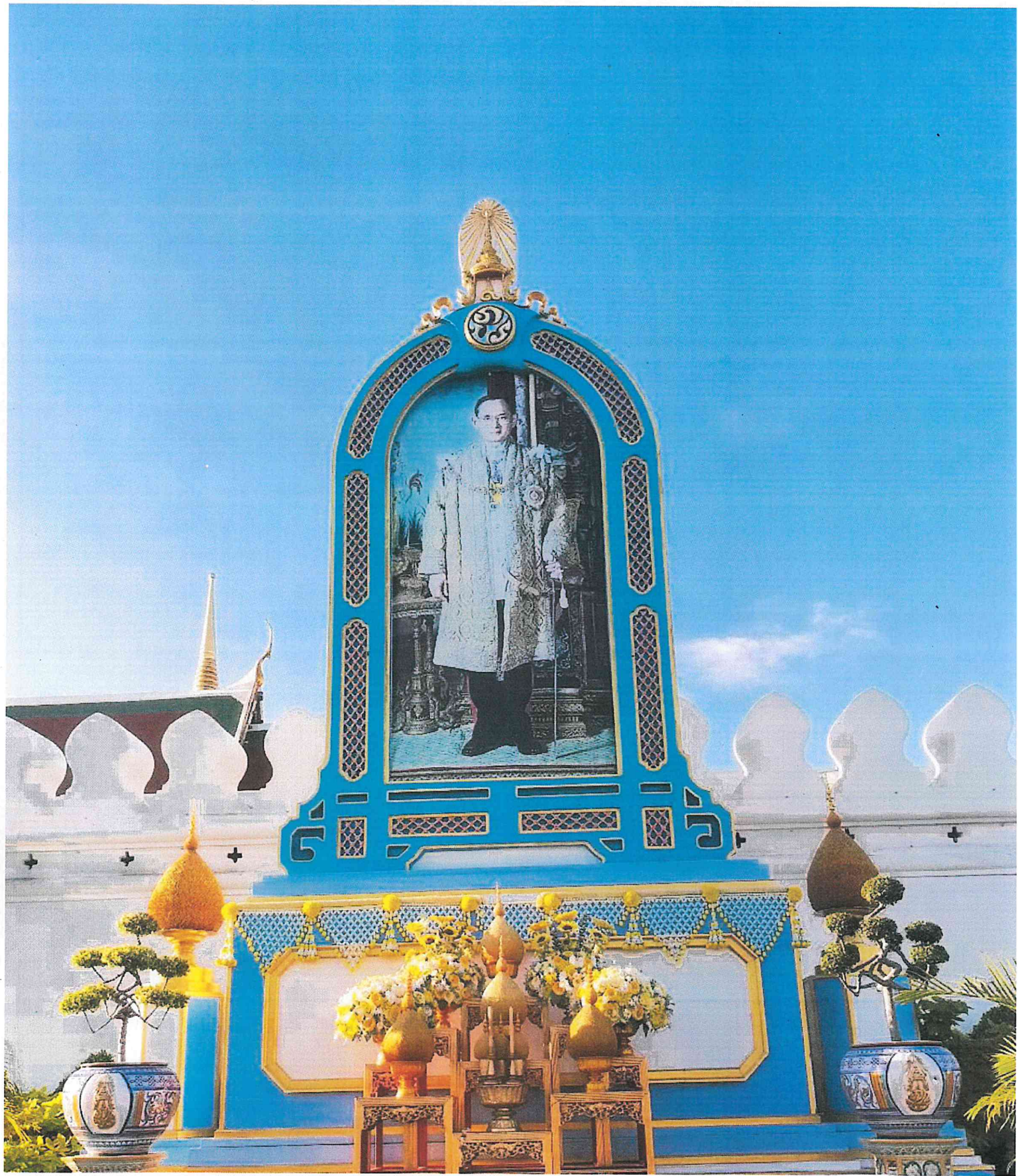
ตัวอย่างเครื่องราชสักการะ