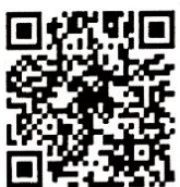
“ข้าวพูดได้”

จึงเรียนมาเพื่อโปรดพิจารณาให้ความอนุเคราะห์เผยแพร่ประชาสัมพันธ์ “ข้าวหอมมะลิลพบุรี” ตราข้าว อคส. ด้วย จะขอบคุณยิ่ง