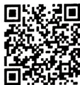
อคส. ครอบอบ ๒๒