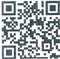
สิ่งที่ส่งมาด้วย ๓

คู่มือการปฏิบัติงานระบบจัดซื้อจัดจ้าง (Purchasing Order: PO)