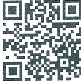
สิ่งที่ส่งมาด้วย ๒

คู่มือการปฏิบัติงานระบบบริหารงบประมาณ (Fund Management: FM)