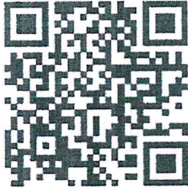
สิ่งที่ส่งมาด้วย ๑

คู่มือการปฏิบัติงานระบบบริหารงบประมาณ (Fund Management: FM)