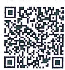
แบบสอบถามความพึงพอใจการใช้งานระบบฯ