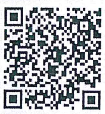
ระบบติดตามความก้าวหน้าการประเมินบุคคลและผลงาน