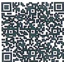
QR Code (1)

สถาบันพัฒนาบุคลากรภาครัฐด้านดิจิทัล กลุ่มงานพัฒนาบุคลากรภาครัฐด้านดิจิทัล มือถือ ๐๘ ๐๐๔๕ ๓๓๔๖ (ทิพย์ศรีน), ๐๘ ๐๐๔๕.๓๓๕๘ (วิระญา) ไปรษณีย์อิเล็กทรอนิกส์สารบรรณกลาง dga@saraban.mail.go.th