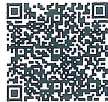
QR Code (3)