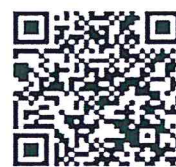
คู่มือการใช้งานระบบ e-Filing