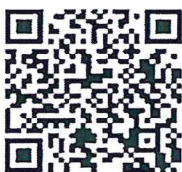
แบบฟอร์ม