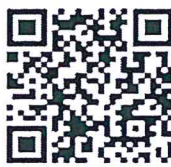
เข้าสู่ระบบ e-Filing