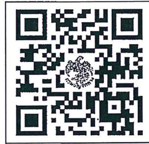
สิ่งที่ส่งมาด้วย ๒

คู่มือเสริมสร้างพื้นฐานการเรียนรู้ การสอบทานรายงานทางการเงินภาครัฐ URL : https://shorturl.at/0fOAH