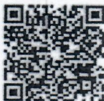
รายละเอียดการสัมมนา