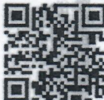
แบบลงทะเบียน เข้าร่วมสัมมนา