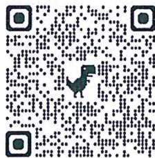
แบบสำรวจความประสงค์ เข้ารับการฝึกอบรม นบส. ปี ๒๕๖๘