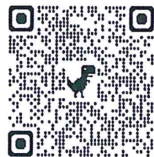
แบบสำรวจความประสงค์ เข้ารับการฝึกอบรม นบส.กษ. ปี ๒๕๖๘