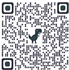
แบบสำรวจความประสงค์ เข้ารับการฝึกอบรม นบค. ปี ๒๕๖๘