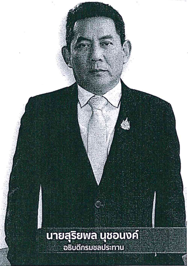
นายสุริยพล นุชอนงค์ อธิบดีกรมชลประทาน